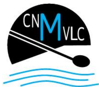
CLUB NATACIÓN MEDITERRÁNEO VLC